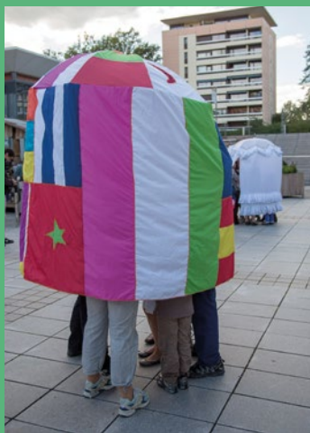
La Patrouille de Parapluies Molière

Sous un petit coin de parapluie, venez à la rencontre des figures archétypales, drôles et grinçantes, de la condition humaine du théâtre de Molière.