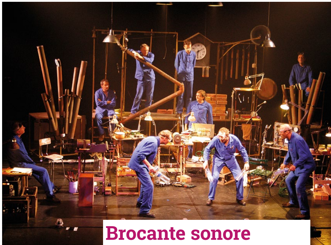
© Michèle Gombert - Ville de St. Pée des Vignes et Lucien Linafo