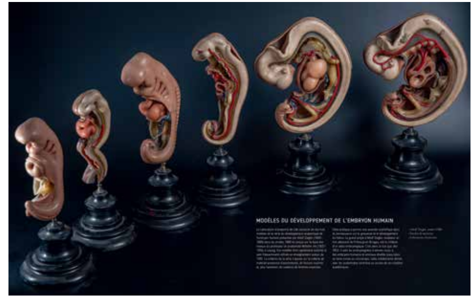
MODÈLES DU DÉVELOPPEMENT DE L'EMBRYON HUMAIN

Les modèles du développement de l'embryon humain sont réalisés en plâtre et en cire. Ils sont exposés au Musée de l'Homme à Paris. Les modèles sont réalisés par le sculpteur et anatomiste Paul Broca (1824-1906) et par son élève, le sculpteur et anatomiste Paul Broca (1824-1906). Les modèles sont exposés au Musée de l'Homme à Paris.