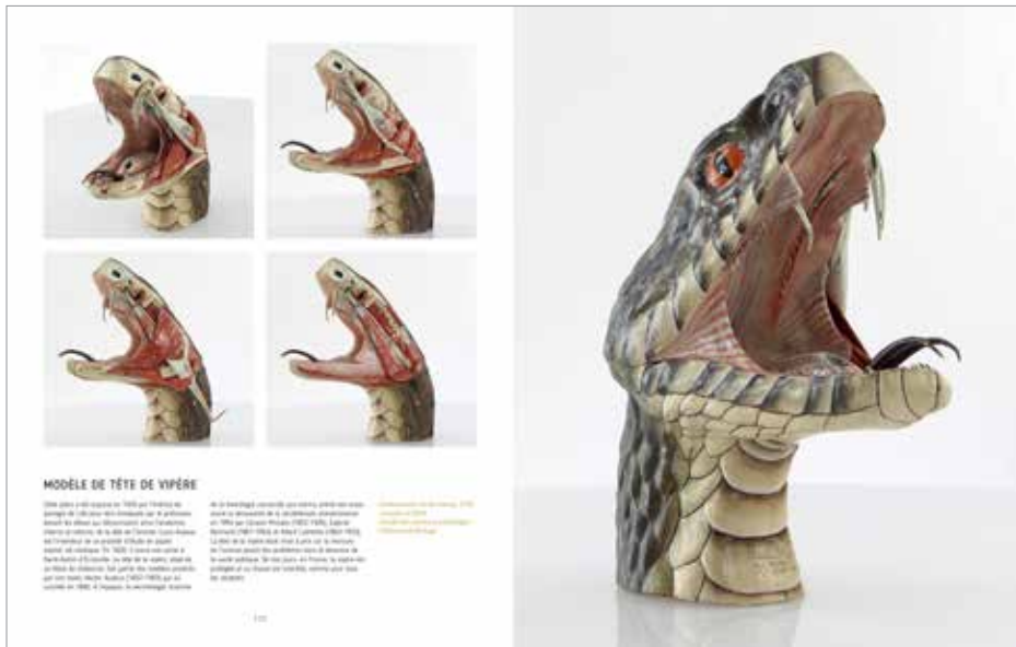
MODÈLE DE TÊTE DE VIPÈRE

Les modèles du développement de l'embryon humain sont réalisés en plâtre et en cire. Ils sont exposés au Musée de l'Homme à Paris. Les modèles sont réalisés par le sculpteur et anatomiste Paul Broca (1824-1906) et par son élève, le sculpteur et anatomiste Paul Broca (1824-1906). Les modèles sont exposés au Musée de l'Homme à Paris.